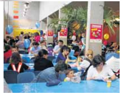
Die Baby-, Kinder- und Familienmesse «FamExpo» lockte am letzten Wochenende über 20 000 Besucherinnen und Besucher in die Winterthurer Eulachhallen. Impressionen von der Erfolgsmesse zeigen wir in unserem Bilderbogen auf Seite 11

Ein «politischer Entscheid» Das neue Gesuch und die Rechtsgrundlagen wurden von Burger King mit jeder zuständigen Amtsstelle im Bauamt vorbesprochen. «Wir wissen, dass dem Stadtrat ein positiver Antrag vorgelegt wurde. Wir wissen auch, dass der Stadtrat einfach nicht wollte, und dass die Verwaltung beauftragt wurde, im Nachhinein eine Begründung für diesen politischen Entscheid zu suchen», sagt Rütimann. Ein solcher Entscheid liege im Ermessen des Stadtrates, gesteht er zwar zu. «Genau so hätte es aber in seinem Er-» > SEITE 3