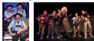
DUOPACK Global Kryner

Unterhaltungsabend im Festzelt Zeughauswiese