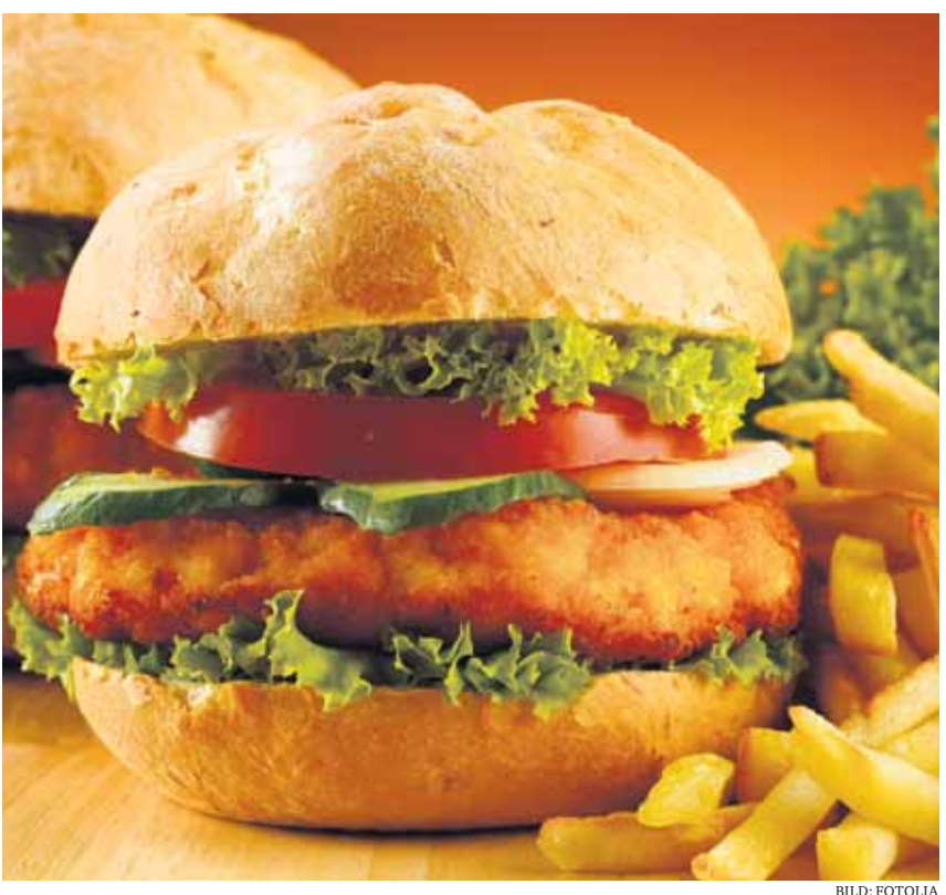
Wer darf an der Zürcherstrasse wie lange in der Nacht Hamburger verkaufen? Die Frage beschäftigt Instanzen und füllt Aktenordner ...